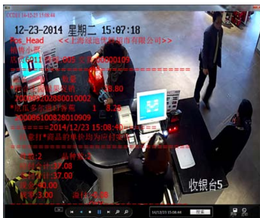
小票信息叠加监控，保障收银安全