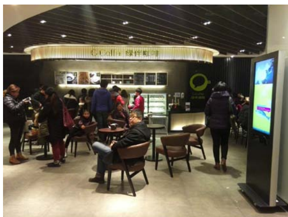
多媒体播放终端，强化品牌传播