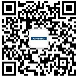
研华客户服务 研华科技售后服务官微