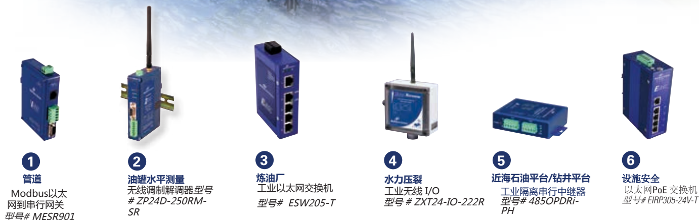
1 管道 Modbus以太网到串行网关 型号# MESR901