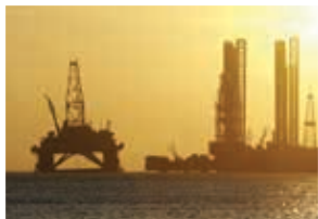
石油，天然气的勘探和生产

B + B SmartWorx在危险环境中为控制、监测和保护系统提供了一个完整的高度安全的连接解决方案。B + B SmartWorx的技术遍及传统和现代能源生产和销售系统和设施。